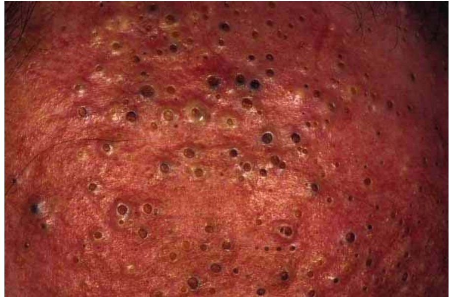
Chloracné : comédons