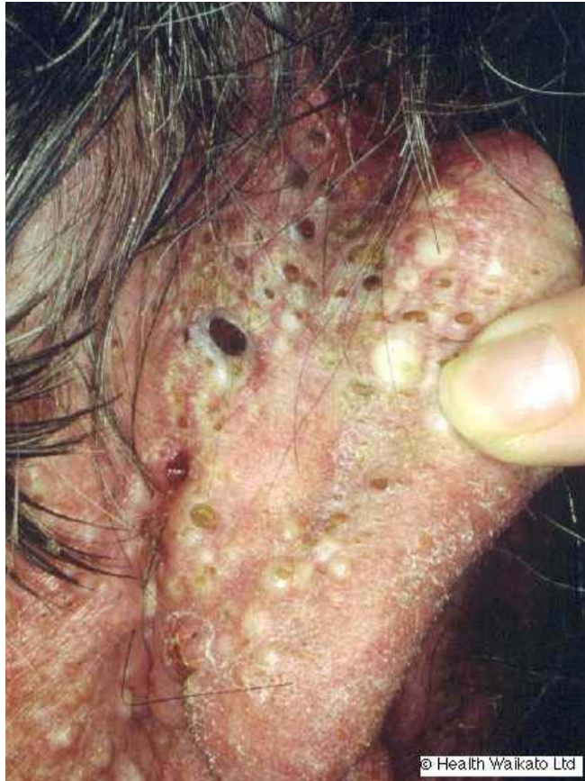
Chloracné : comédons et kystes